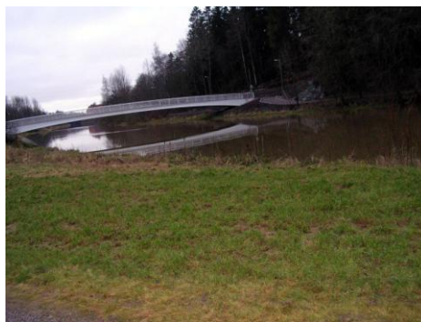
Puolimaratonin reittiä Vantaanjoella

Lisätietoja ja ilmoittautuminen sivulla www.helsinkispringmarathon.com